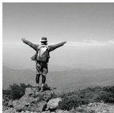
シー・キャド株式会社

仕事以外の時間は、極力スマホの電源を切り、日常から離れるようにしています。趣味というか、広く深くハマるのが常に 変化しながら沢山あります。今は釣りにハマっていますが変わらなく続くものもあります。映画・キャンプ・サッカーです。映画は、ハッピーソッカーのようなハリウッド系娯楽映画ではなく、筋書き通りにならないワケ感、チョットの不便さ、思い通りにいかない感じが面白い(笑)。サッカーもやっぱりシステムチックな戦い方をするドイツ等は、見ていて楽しくないかな〜(汗)。小学三年生からずっとブラジルファンです(汗)型にハマったものではなく感覚的なものに魅力を感じます。たぶん、これからも... 決まりきった便利な毎日の中で、機器等に頼り過ぎず人や自然とのコミュニケーションを大切にしていけたら良いと思います。