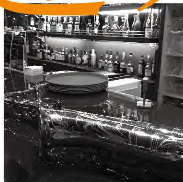
(株)GAC 株アドコーポレーション営業部