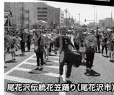
尾花沢伝統花笠踊り(尾花沢市)