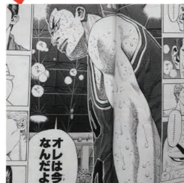
株式会社山形アドビューロ

皆さん、植物の名前言えますか？私は言えません…。でも、休みの日はよく植物園に行っています。晴れた日の午前中に行くのがベストです。私の大好きな、草木と土の香りが混じった涼しい風が吹いています。その風を浴びに行っていると、言っても過言ではないほど。また、汗ばむ程度に歩き、木陰のベンチで休憩して何も考えずにボーッとする気持ちよさは格別です。園内の英式・日本庭園は季節によって表情が変わり、何度行っても飽きません。そう言えば、植物園で好きになった植物があります。絶滅危惧種のオキナグサです。有名な姿はたんぽぽの綿毛のようになった姿ですが(名前の由来も白髪の老人に例えて)、私が好きな姿はツボミの状態です。丸く親指の先ぐらいの大きさで、表面が柔らかな毛で覆われており、猫の後頭部のような触り心地に心を奪われてしまいました。ただし有毒なので、汁等がついたらすぐに洗い流しましょう。カメラの趣味も相まって、写真を撮って歩いていると、いつの間にか夕方になっています。園を一日で回り切るのは難しいので、次来たときのお楽しみと思って気持ちよく帰ります。ボーっとしたい時に植物園、オススメですよ。